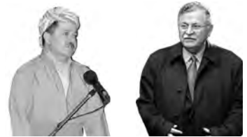
برووسكهى پيروزابايى ... ل ٦

بلاوكراوهى «مهلبند» كاروانى سووربوون ... ل ٢١