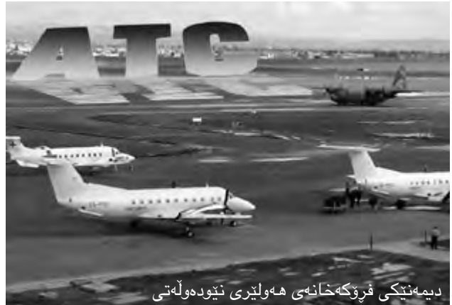
دیمه‌نیکی فرۆکه‌خانه‌ی هه‌ولێری نیوده‌وله‌تی

– له‌ هه‌گبه‌وه... پشتمه‌رگه‌ی ته‌قاویت... ل ٧٤