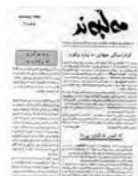
نووسىنى: رهنجق هورمزيار

بلاوكراوهى «مهلبند» كاروانى سووربوون ... ل ٢١