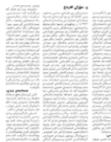
نووسىنى: ههرىم جاف

نيمچهسهرنجىك له يادى رۆژنامهگهريى كورديدا ... ل ١٦