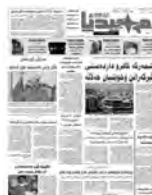
نووسىنى: ئاشتى شريف

ئايا ههر دوو رۆژنامهى كوردستانى نووى و خبات ... ل ١٧