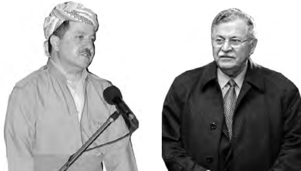
بەريژان ئەندامانى مەكتەبى سىياسىي يەكئيتتى نىشتىمانىي كوردستان

وئىراى ريز و سلاومان، ھىواى سەرکەوتنتان بۆ دەخووزين.