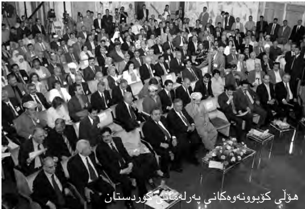
هۆلى كۆپونوههكانى بهرلهمانى كوردستان