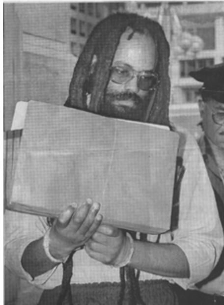
مومیا ئەبو جەمال