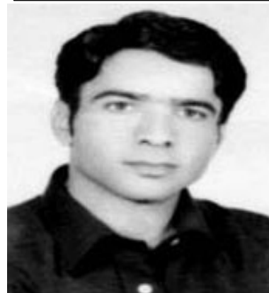
با ... گویره ری بانی زید - یش به ئیفیل و ئه وروپا وه پرسه گه یزی ئەم غه دره بن . با ... سه فین و ئەزمه ی، به غه ربی بریا یه تی به وه بتلینه وه ... ناخ ... 4 ئایاری 2005 .

سه بی - کام شه قام ژان به ژن و تیرۆر و T.N.T یه وه ده گری . سه بی، کام بنگه و باره گا، رووباری خوین له ئامیز نه گری . سه بی، کام پۆله دایک ره شه پۆش نه که ن بۆ قوربانی . سه بی، کام قه له م و کام چه ک بێ هه قال ده پتون ئابنده . سه ما بکه ن ... سه ما هه تا ئیتمه دژ به یه ک و ناتهباین باین، هه تا ناسیۆنالیزم وه کو که رامه ته ی ئینسان ی کورد، له ژیر گوشاری سه ختی پارتبایه تی برینداره و بێ ده رمان . سه ما بکه ن یه کی شو بای ... چواری ئایار ... سه بی کام رۆژ ... برووسکە ی سه ره خۆشی گوپچه کی ئاسمان که ر ده کات