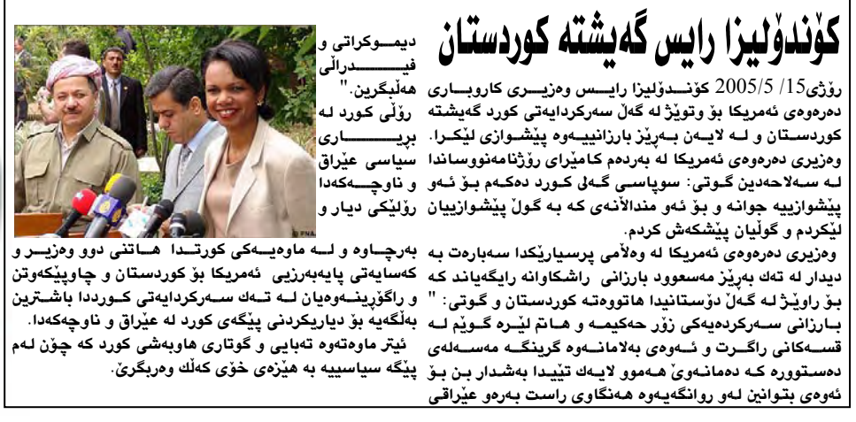
دیموکراتی و فیئدرالی ھەلبەرگین. 2005/5/15 کۆنۆلیزا رایس و ھەزیرە کاروباری ھەرھەوی ھەمەریکا بۆ تۆیژ لە گەل سەرکۆرایەتی کورد گەشتە کوردستان و لە لایەن بەرپرۆژە پێشوازی لیکرا. ھەزیرە کاروباری ھەمەریکا لە بەردەم کامپرای رۆژنامەنووساندا لە سەھەدەین گوتی: سوپاسی گەل کورد دەکەم بۆ ئەو و ناوچەکاندا پێشوازییە جوانە و بۆ ئەو منداڵانە کە بە گۆل پێشوازییان رۆژێکی دیار و لیکردم و گۆلیان پێشکەش کردم.