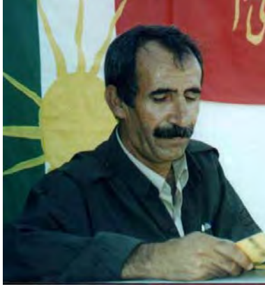
جگه نه ختی سه ره به سته ی و بستی خا ک و ئالایه ک و ره شمائیکی قهره جانه .